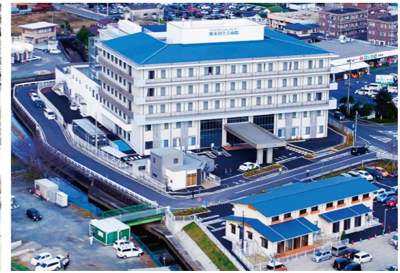
【右】2015年に病院新築リニューアル。2017年に開院40周年を迎えた【左】手術日は週に4日設けられ、一日に2~3名の手術が行われる