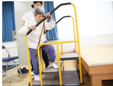
【上】日曜、祝日を含む365日リハビリを実施し在宅・社会復帰を支援 【右】回復期病棟には専用の訓練室を設け集中的にリハビリを行う 【中】専門医、リハビリスタッフ、看護師等の多職種で行うリハビリテーション回診【左】患者の状況を共有するため、カンファレンスを密に行う